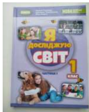
2. Т.Г.Гільберг Я досліджую світ 1 кл., Іч. (у 2-х частинах) (2024).