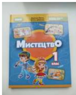
1. Л.М.Масол Мистецтво 1 кл. (2024)